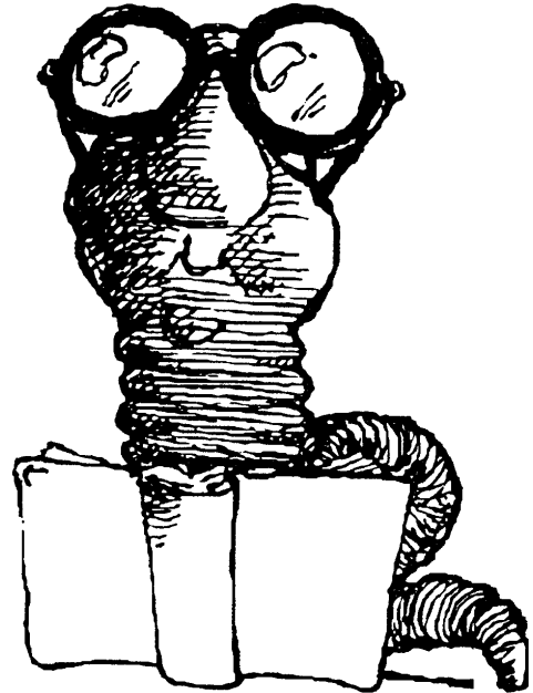
häufiger Vertreter des studiosus theologicus: der Bücherwurm

Die vorliegende Fassung ist an die ab WS 2009/10 geltenden Studien- und Prüfungsordnung angepasst. Sie ist auch im Sekretariat erhältlich. Vollständigkeit und Richtigkeit wird nicht garantiert. Verbindlich sind die jeweils gültigen offiziellen Ordnungen: Studien- und Prüfungsordnung, Modulhandbücher, Studierendenschaftsordnung etc.