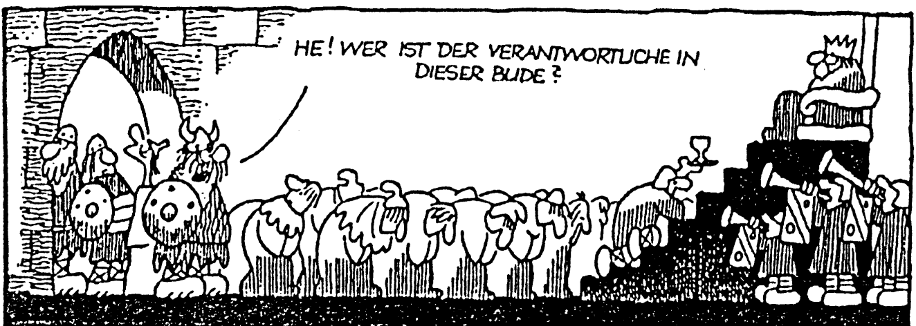
Die entscheidende Frage

Studien- und Prüfungsordnung, Modulhandbücher, Hausordnung, Studierendenschaftsordnung